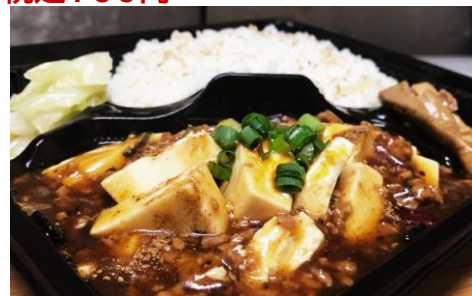
麻婆豆腐弁当 税込650円

<特徴>店内でも人気の「俺達の麻婆豆腐」をお弁当用にアレンジしました。山椒ほか豊富なスパイスの香りが広がり甘みのあとにピリッとした旨辛さが口の中に広がリクセになります。ご飯が進みますのでご飯大盛(税込100円)もあつという間に平らげられるかも?!