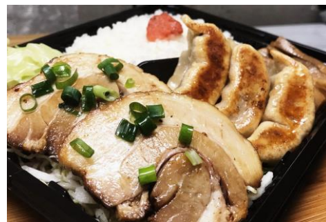
肉汁焼餃子&炙りチャーシュー弁当 税込700円

<特徴>ダンダダン酒場の看板商品「肉汁焼餃子」は、豚肉と厳選素材をしっかりと練り込んでそれぞれの旨味をしっかりと引き出しています。そのため醤油や酢など何もつけずにそのまま美味しく召し上がっていただける餃子です。肉がたっぷりつまった餡ともちもちした皮、そしてたっぷりの肉汁をご飯と一緒に楽しみいただけます。