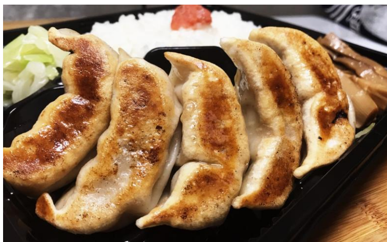
肉汁焼餃子弁当 税込み650円